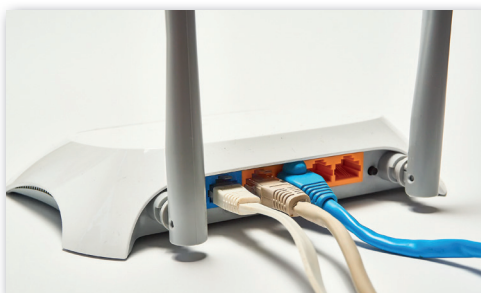
► Otthoni wifirouter

Milyen berendezésekre lesz szükségünk, ha szeretnénk otthon internetezni? Először is a szolgáltató optikai kábelt húz a lakásunkig. Ekkor kell egy modem , hogy az optikai jelet átalakítsuk. Ezután egy routerre lesz szükség, hogy a lakásunk helyi hálózatát az internethez kapcsolhassuk, a hálózatunkból érkező kérések eljuthassanak a szerverekhez, és onnan a válaszok beérkezzenek hozzánk. Ha több számítógépet szeretnénk vezetékiesen a netre kapcsolni, akkor szükségünk lesz a helyi hálózatunkon belül egy switchre is. Ha a mobiltelefonunkról is használni akarjuk az otthoni internet-elérést, akkor a vezeték nélküli kapcsolat biztosításához egy AP is szükséges.