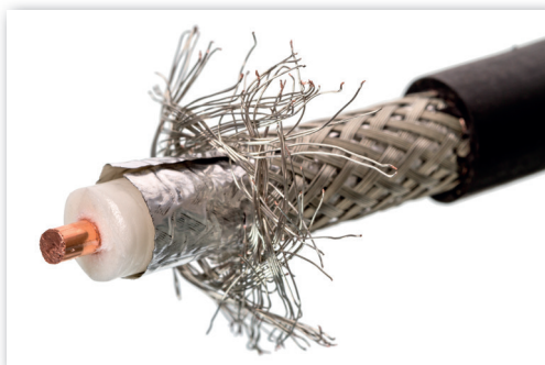
► Koaxiális kábel